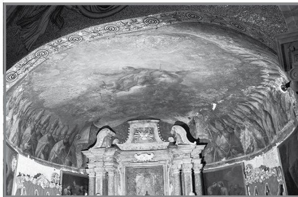
Il-pittura mas-saqaf tas-Santwarju

Dan il-pittur kien pittur is-saqaf tas-Santwarju fejn hemm l-artal. Dan juri t-Trinità Mqaddsa u għadd t'isfijiet. Dawn l-isfijiet kienu għaddew minn Malta fi triqthom lejn il-Konċilju ta' Kartagni fis-sena 409. Teżisti tradizzjoni li l-Għar tal-Madonna tal-Mellieħa kien ġie kkonsagrat minn dawn l-isfijiet 26 .