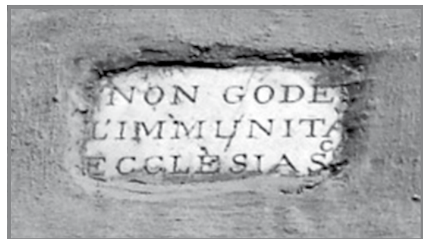
Il-lapida mwaħħla mat-Torri l-Aħmar

Mal-faccatta tat-Torri l-Aħmar, insibu lapida bil-kliem Latin "Non Gode L'Immunità Ecclesiastica". Din tfisser li dan il-post ma joffrix kenn għal persuni mfittxija mill-gustizzja. Dawn il-lapidi huma l-aktar mwaħħla ma' diversi kappeli, imma peress li ġewwa l-imsemmi torri kien hemm kappella ddedikata għal Sant'Agata, din ir-regola kienet tapplika għal hemm ukoll.